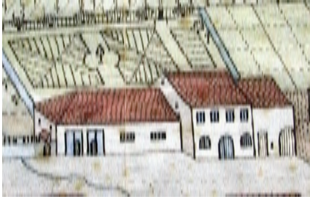
Torkelhaus Untergasse Sargans (Zeichnung J.-B. Gallati, im Besitz des Historischen Vereins Sargans)